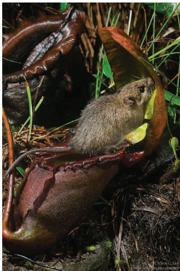
Ryc. 1. Rattus baluensis na organie łownym Nepenthes rajah ([1], plik niezmienny)

liczne przypadki żywienia się tego gatunku kręgowcami. Świadczą o tym niestrawione kości wewnątrz dzbanca. Jednak nadal znacznie częściej wybierają one drobne owady (Chin i in., 2010).