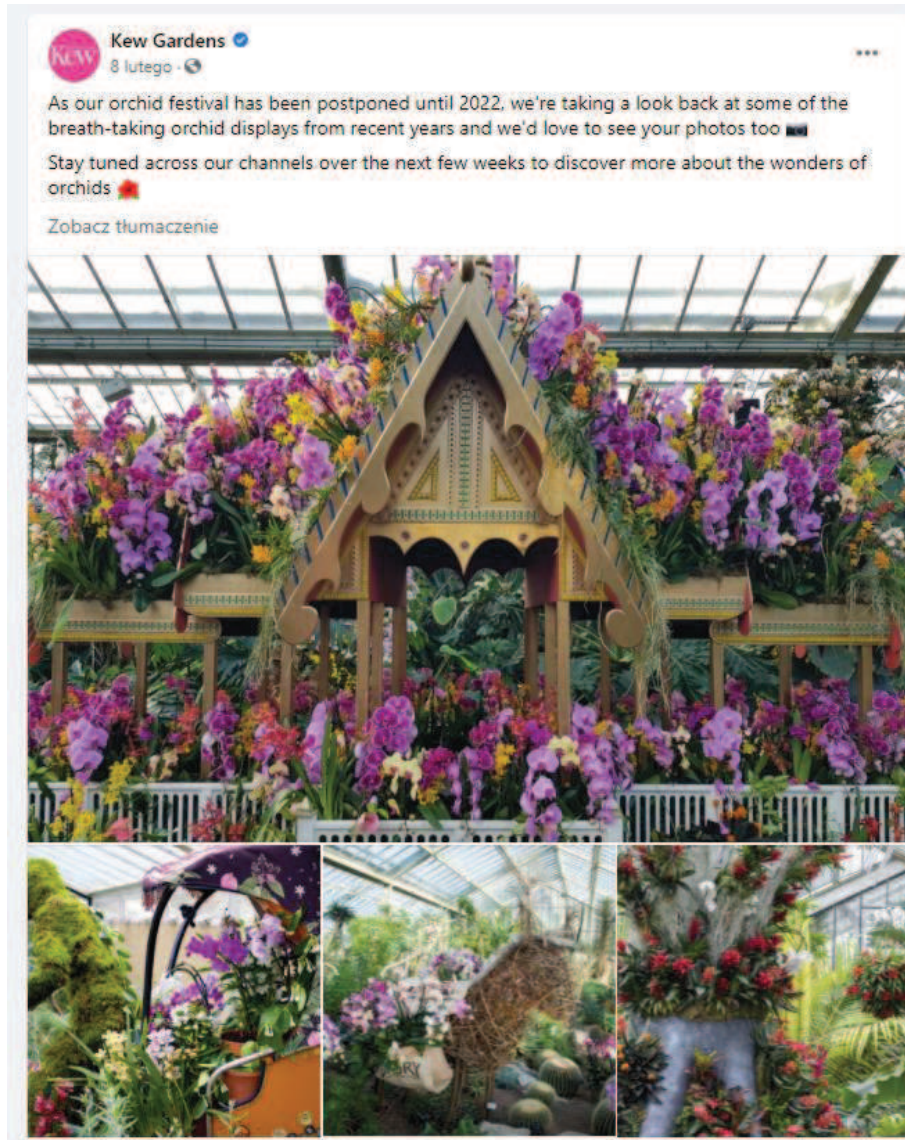
Ryc. 1. Wystawa w Królewskich Ogrodach Botanicznych (Royal Botanic Gardens) w Kew, Wielka Brytania ([2] post publiczny, udostępniany na prawach cytatu)

dostępna do zwiedzania wystawa „Kew Gardens’ Orchids 2022: Costa Rica” odzwierciedlająca bogactwo naturalnego środowiska storczyków tego kraju [1].