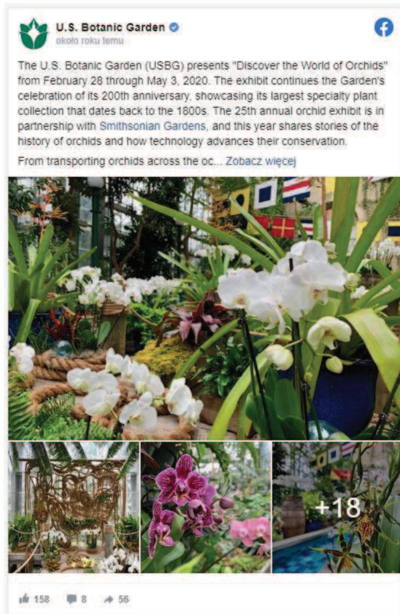
Ryc. 2. „Discover the world of Orchids” United States Botanic Garden ([4], post publiczny, udostępnienie na prawach cytatu)